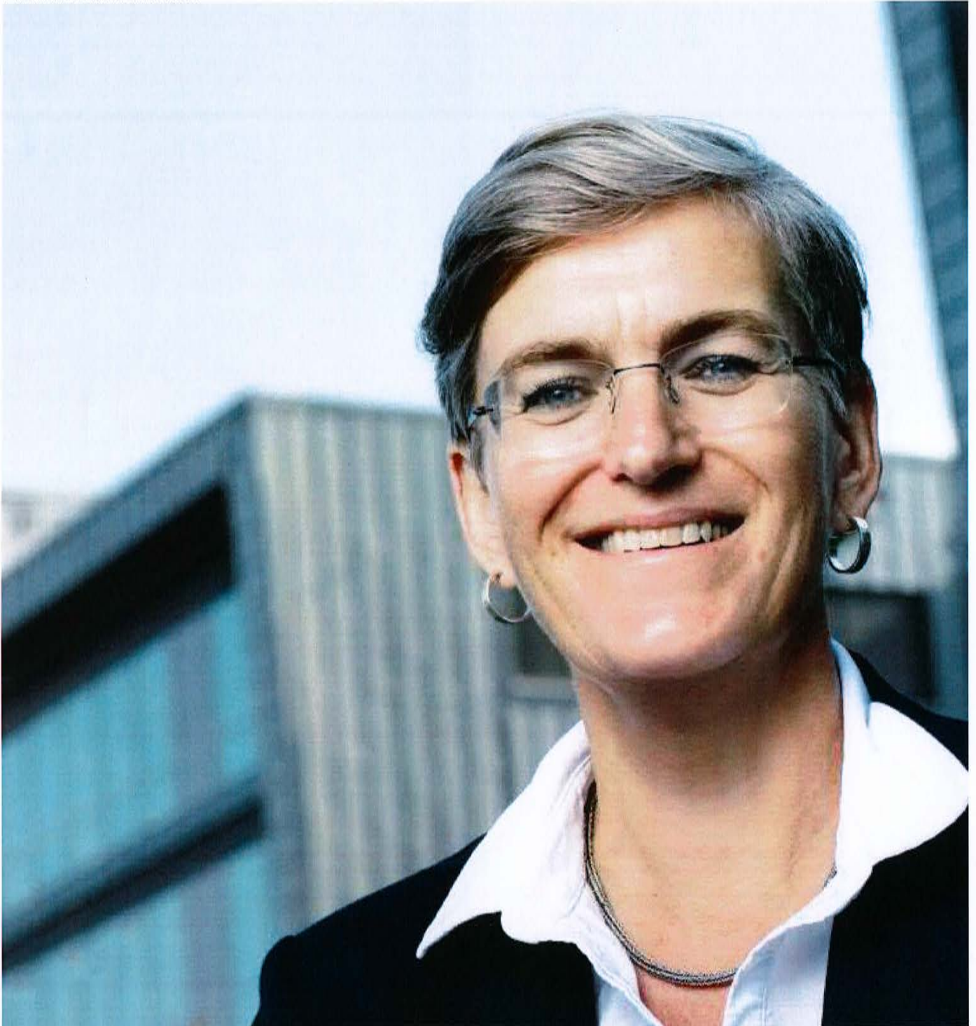
Ellen Hambro, direktør i Miljødirektoratet.