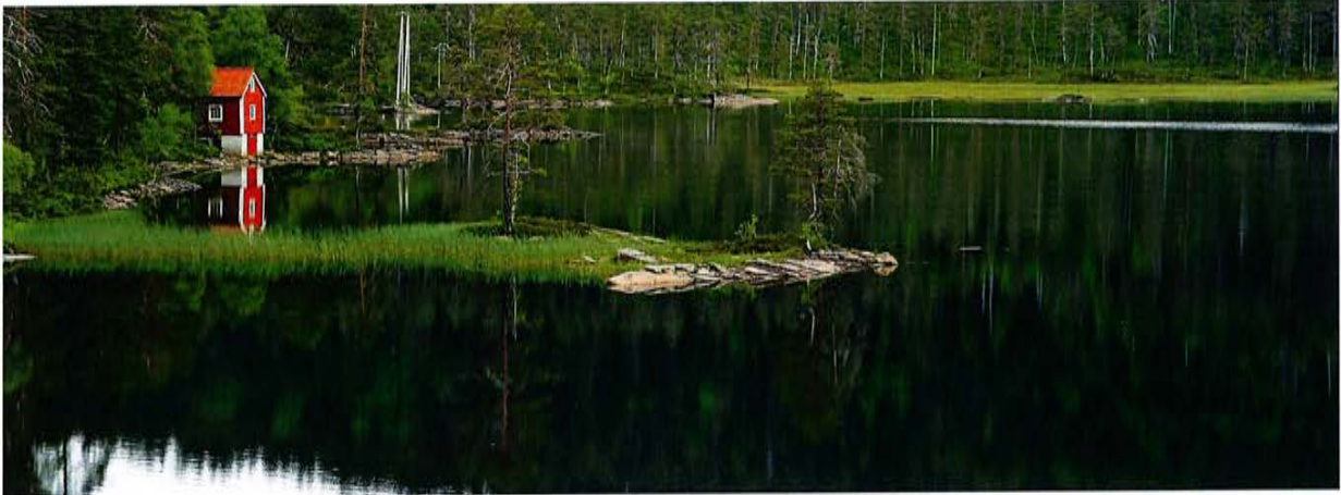
Illustrasjonsbilde fra Markane.