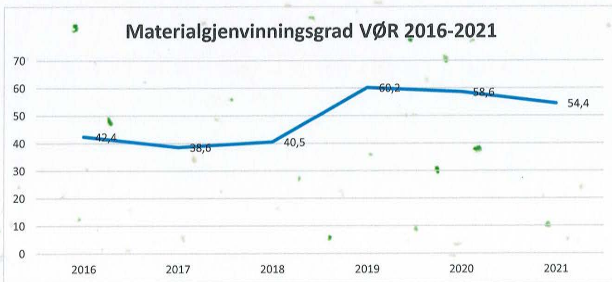
Figur 2 Materialgjennvinningsgrad 2016-2021

Diagrammet under viser korleis materialgjennvinningsgrada til VØR gradvis har bevegde seg oppover frå 2016, før eit hopp kom med matavfallinnsamlinga i 2019. Det har deretter vore ein jamn nedgang frå 2019 til 2021, mykje grunna koronapandemien og auka kvalitetskrav på råvarene.