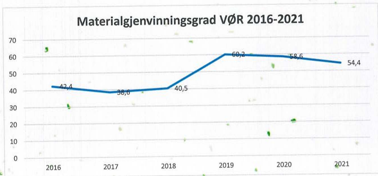
Figur 2 Materialgjennvinningsgrad 2016-2021

Diagrammet under viser korleis materialgjennvinningsgrada til VØR gradvis har bevegde seg oppover frå 2016, før eit hopp kom med matavfallinnsamlinga i 2019. Det har deretter vore ein jamn nedgang frå 2019 til 2021, mykje grunna koronapandemien og auka kvalitetskrav på råvarene.